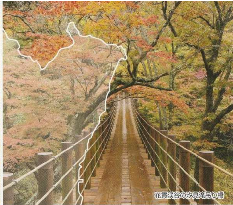
花貫溪谷の汐見滝吊り橋